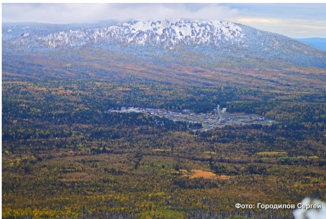
2. Вид с горы Москаль на пос. Сибирка и гору Сука