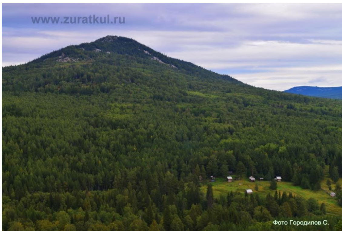
1. Большой Москаль, фото Городилов С.А.