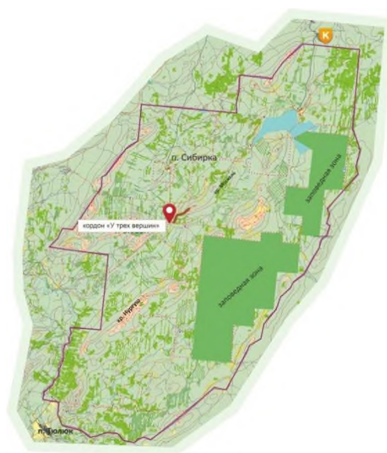
Карта-схема национального парка «Зюраткуль» с маршрутом «Большой Москаль»